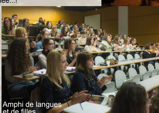
Amphi de langues et de filles...

MERCI À TOUTES CELLES ET CEUX QUI SOUTIENNENT LES ACTIVITÉS ARTISTIQUES DU CAILLOU