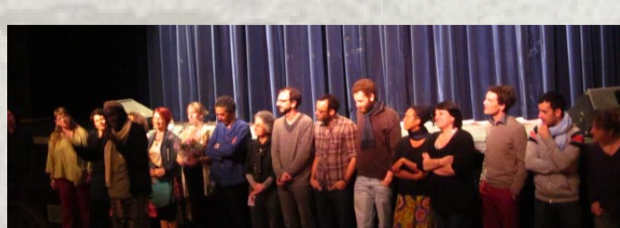
8 ème Plateforme du Conte en Picardie